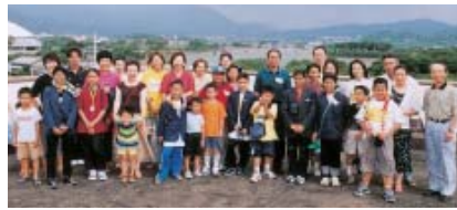
2002年のホームステイから