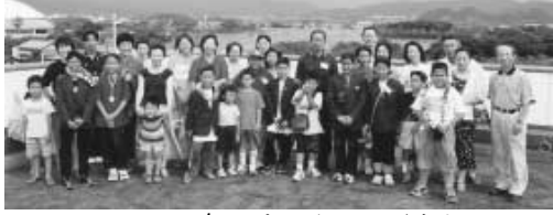
2002年のホームステイから

アジア太平洋の国と地域から子どもたちを招き、彼らが福岡の人々とのふれあいを通し、地球の平和について考える「アジア太平洋こども会議・イン福岡」も今年で16回目を迎えます。