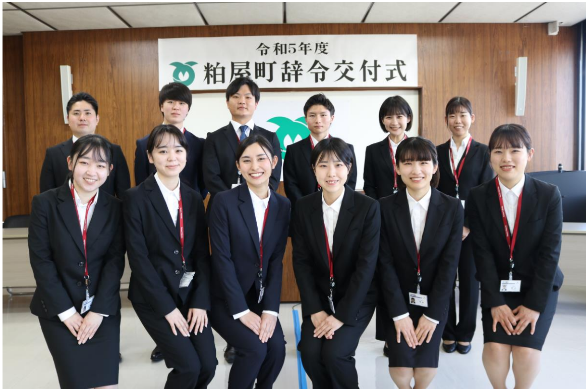
令和5年4月採用職員