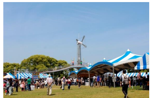
（駕与丁公園におけるイベント）