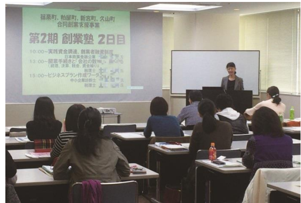
（創業塾・創業セミナーの開催）