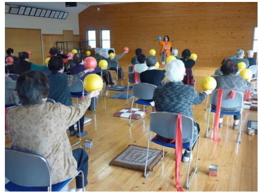
(ゆうゆうサロンの活動)