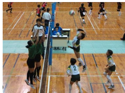
（ジュニアスポーツ）