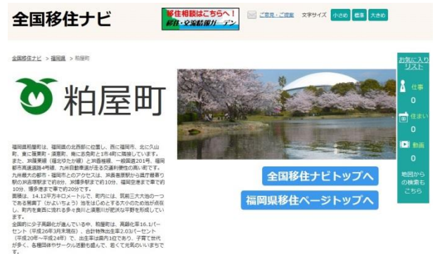
（移住者むけウェブサイト開設）