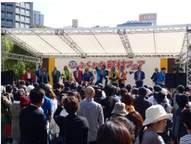
（地域ブランド創出）