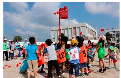
（地域交流イベント）