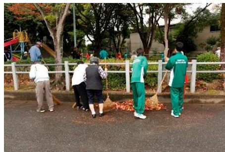
(ボランティア活動)