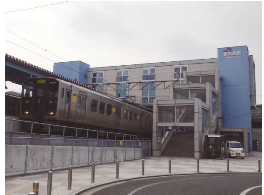
(地域公共交通の充実)