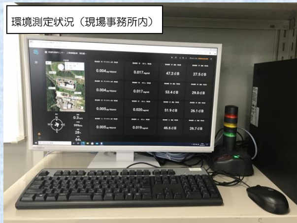
環境測定状況（現場事務所内）