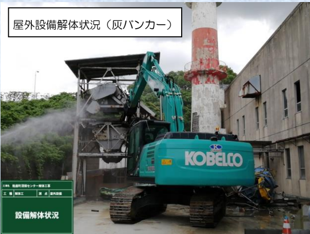
屋外設備解体状況 (灰バンカー)