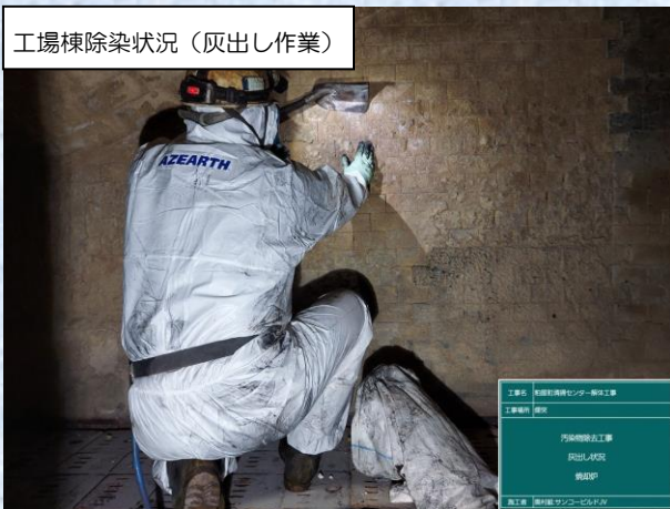
工場棟除染状況 (灰出し作業)