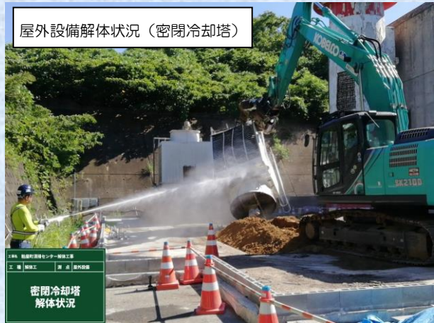
屋外設備解体状況 (密閉冷却塔)