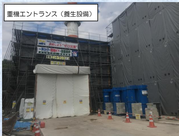
重機エントランス（養生設備）