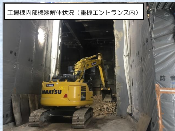
工場棟内部機器解体状況（重機エントランス内）