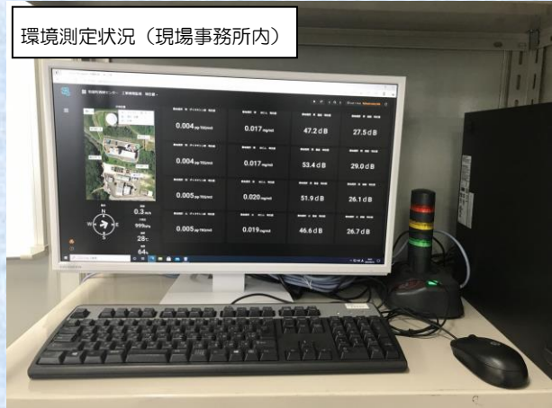
環境測定状況（現場事務所内）