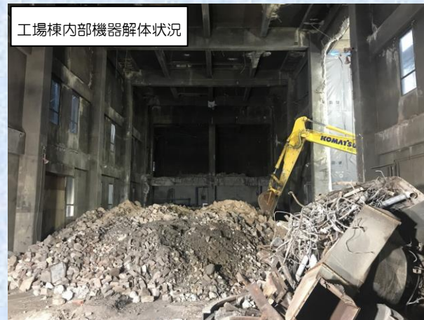
工場棟内部機器解体状況