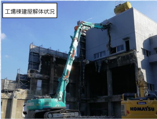
工場棟建屋解体状況