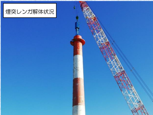
煙突レンガ解体状況